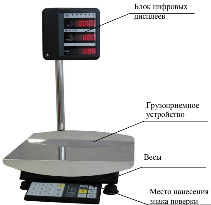
Рисунок 1. Весы ПВМ-3/6-Т, ПВМ-3/15-Т, ПВМ-3/32-Т. Внешний вид